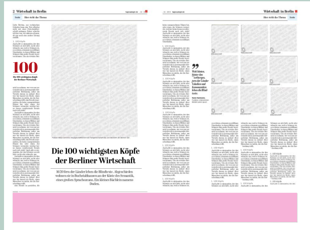
Panoramaspread (unverbindliche Musterseite)

Erscheinungstermine: täglich vom 17.04. – 21.04.2023 sowie vom 24.04. – 28.04.2023 Anzeigenschluss: 2 Werktage vor Erscheinungstermin, 10 Uhr Format: Das Panoramaspread ist ein unechter Panoramastreifen; für ein gutes Druckergebnis wird empfohlen Text und Bild nicht unmittelbar auf dem Bundsteg zu platzieren. Platzierung: Regionales Buch im Ressort Berliner Wirtschaft Verbreitung: Tagesspiegel Auflage: 98.013 Ex. verkaufte Auflage, Mo.-Fr. IVW III/2022 Kontakt: Tel.: (030) 29021-15600 dispo@tagesspiegel.de