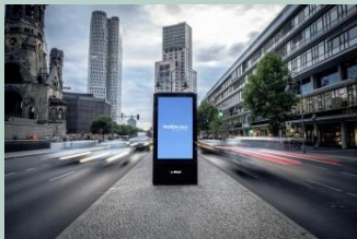
Musterbeispiel eines City Light Posters

Werbeträger für digitale, animierte Inhalte