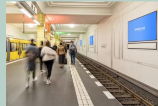
Musterbeispiel Digital Poster Gallery

Werbeträger für digitale, animierte Inhalte