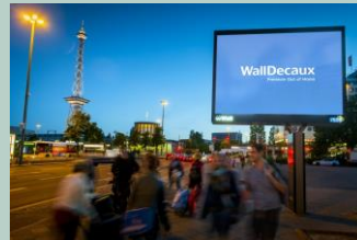
Musterbeispiel eines City Light Boards

Werbeträger für digitale, statische Bilder