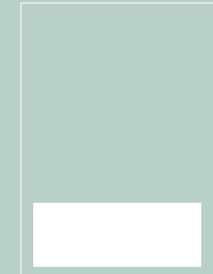
1/4 Seite quer B 247 x H 93 mm